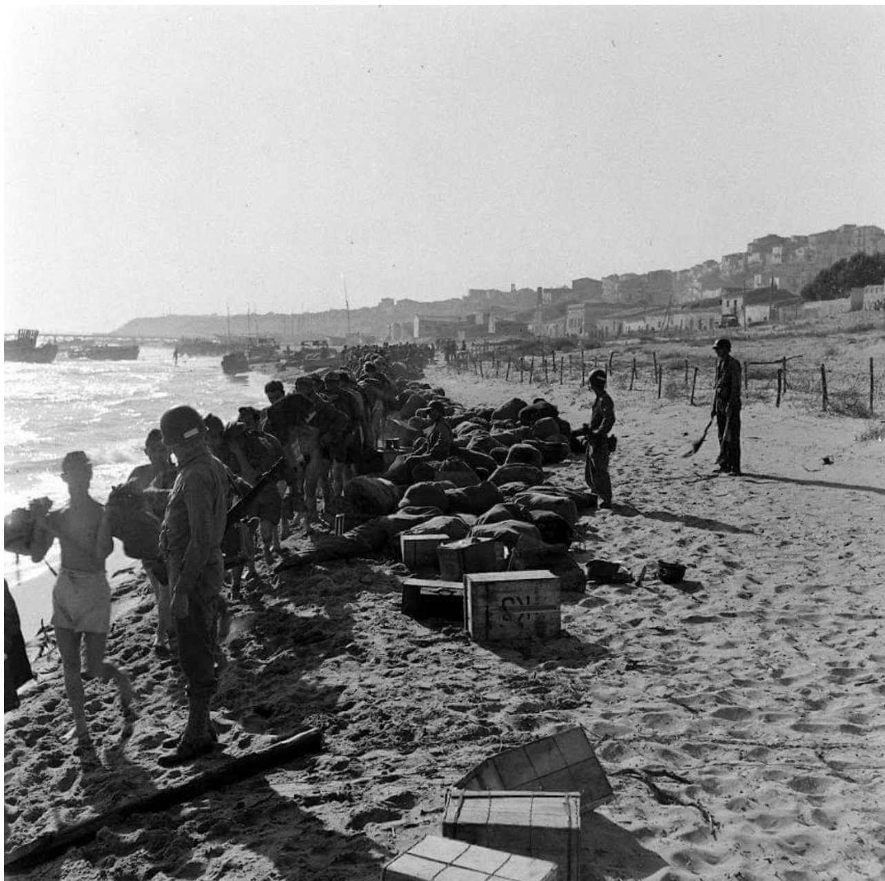
Litorale gelese, Lungomare Federico II di Svevia