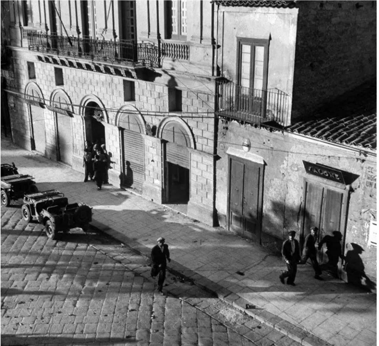
Palazzo Nocera, Corso Vittorio Emanuele, angolo con Piazza Umberto I