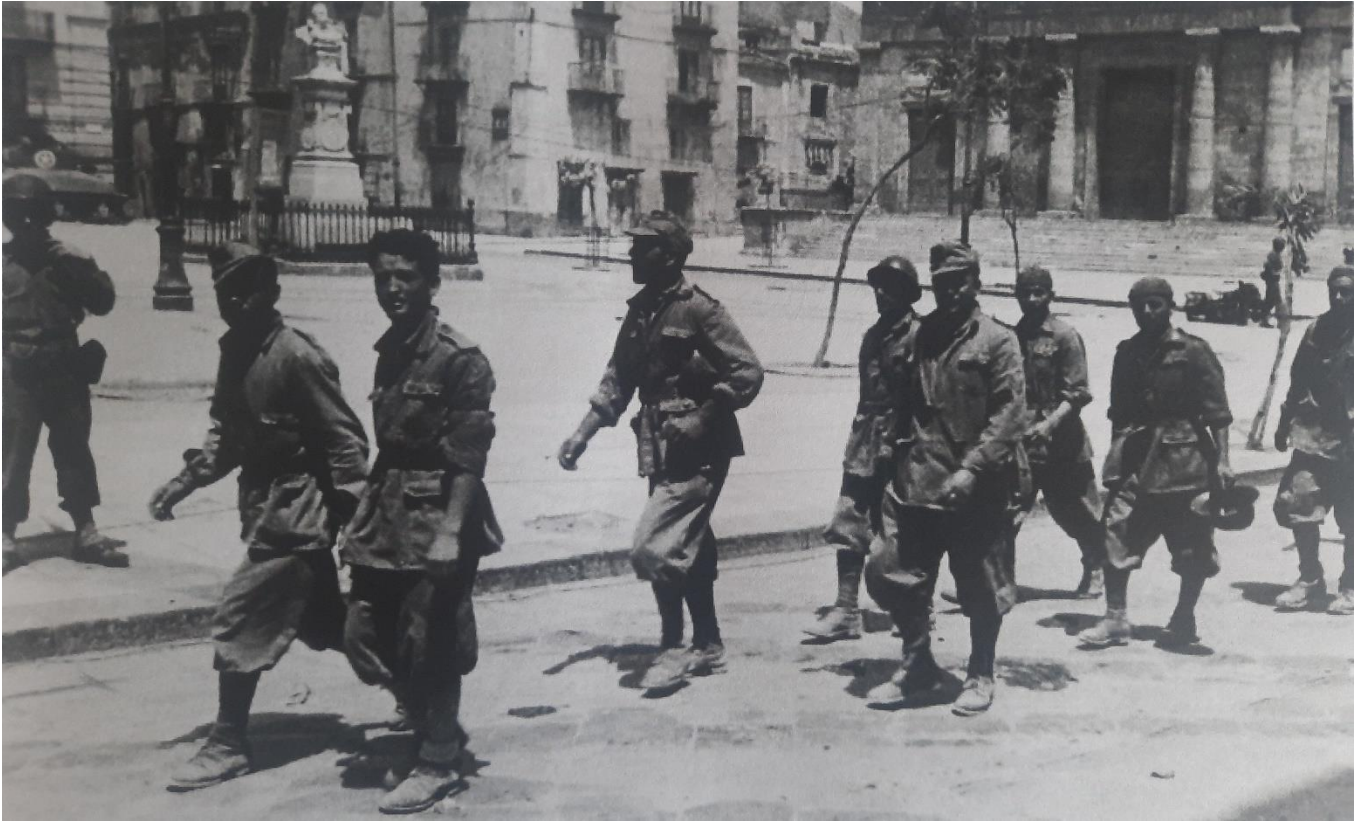
Piazza Umberto I