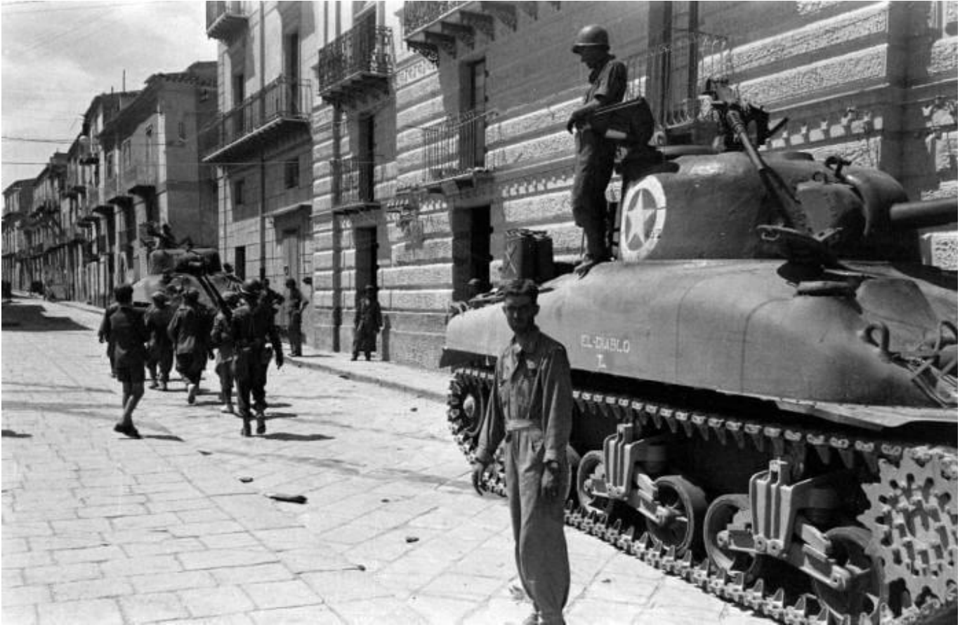
Via Navarra, angolo con Via Aretusa