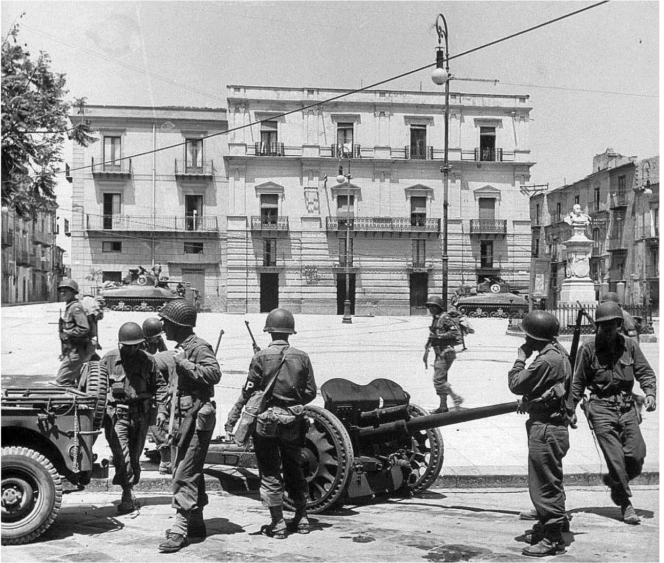
Piazza Umberto I