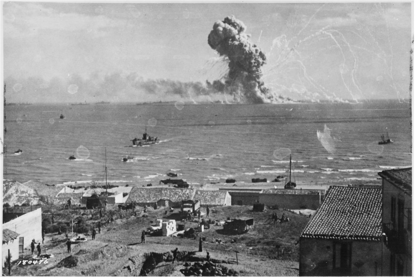
Area Giardino Orto Fontanelle