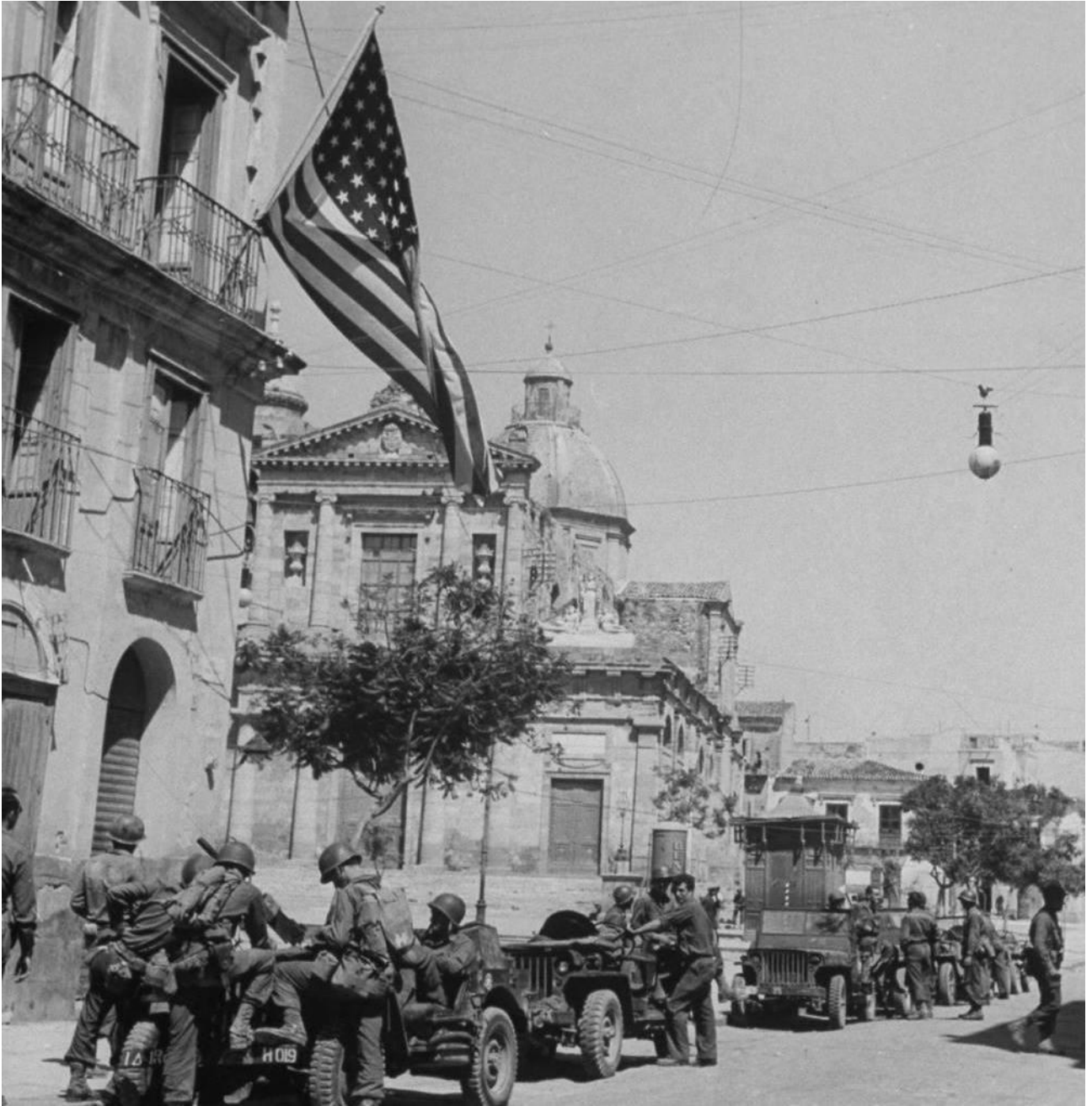
Piazza Umberto I